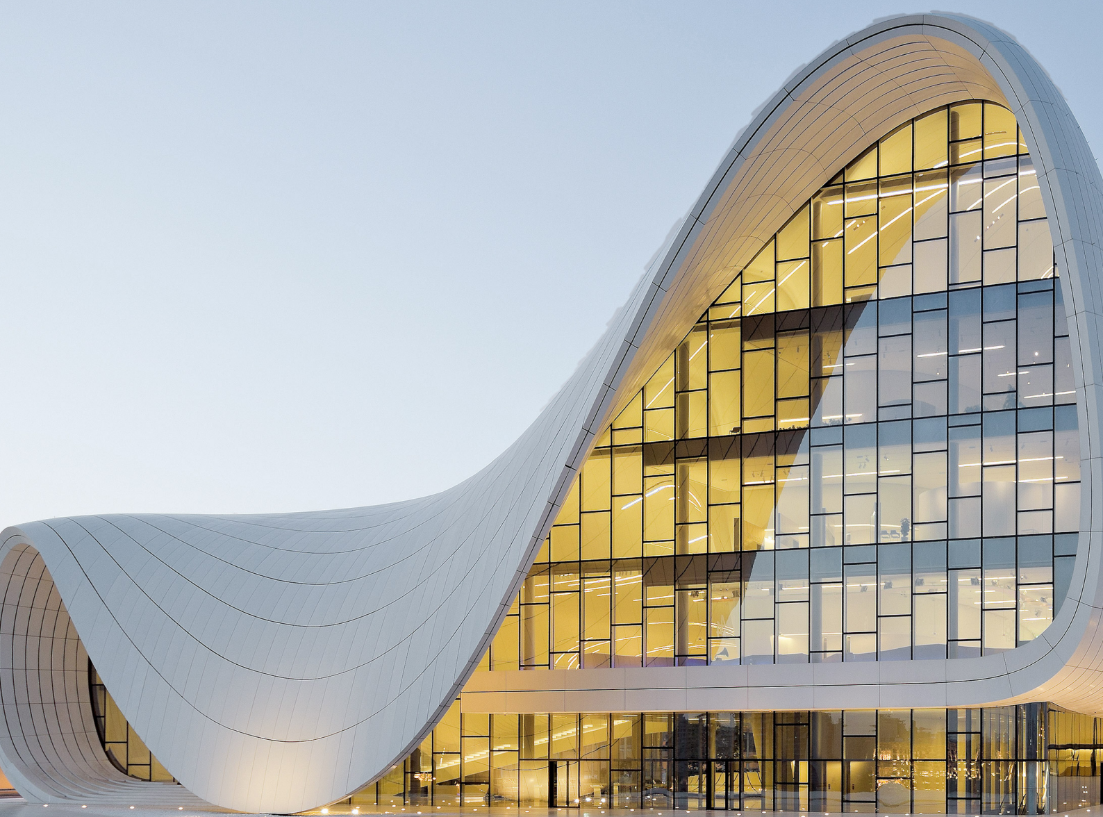
HEYDAR ALIYEV CENTER