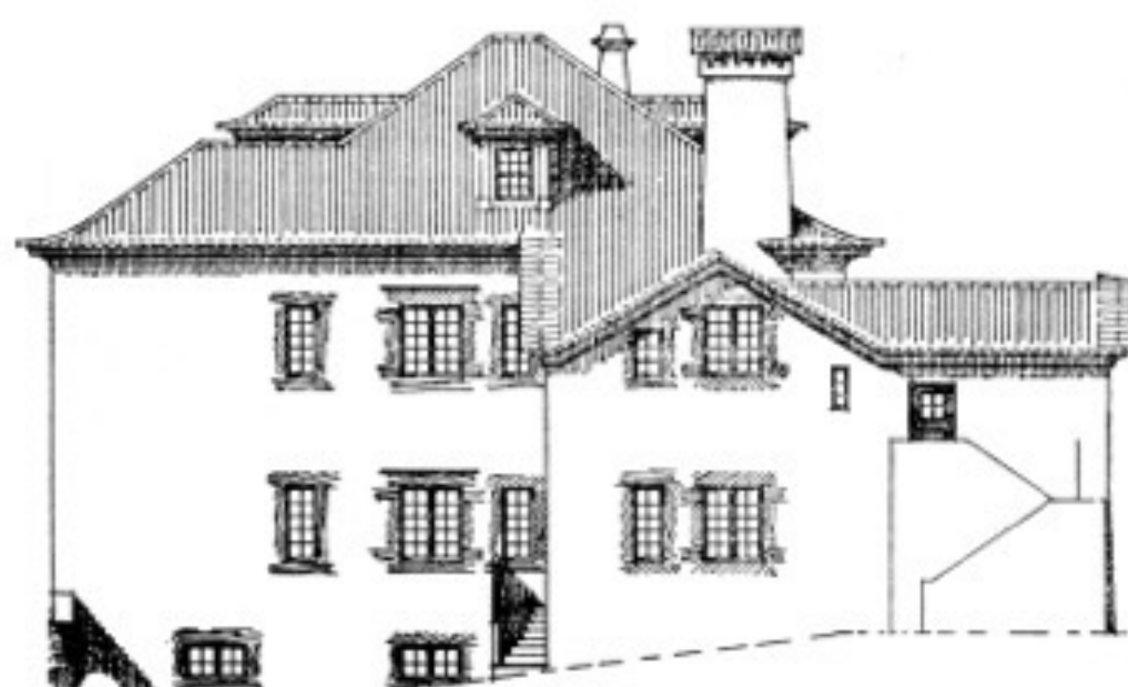
10. CASA NUMA TERRA-DE-ÁGUAS NO MINHO. (Cf. figs. 9 e 10a)